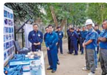
« Projet de réduction des frais d'eau impayés dans le district du Nord Mayangon, région de Yangon », République de l'Union du Myanmar, année fiscale 2013