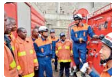
« Projet de réutilisation de véhicules de pompiers de seconde main dans le district de Nairobi », République du Kenya, année fiscale 2015