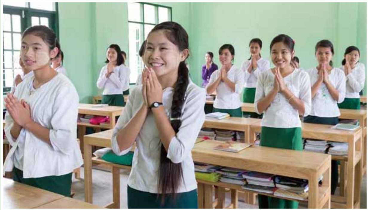
« Le Projet de construction d'un établissement d'enseignement primaire et secondaire à Kunlong, district de Kunlong, État Shan », République de l'Union du Myanmar, année fiscale 2013