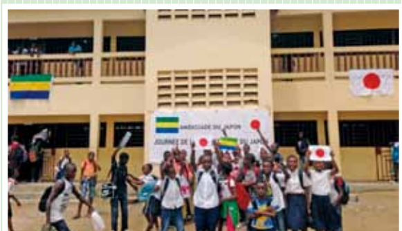
« Le Projet d'agrandissement et d'équipement de l'école publique des Charbonnages », République du Gabon, année fiscale 2013