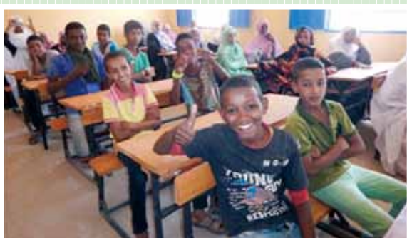
« Le Projet d'aménagement de l'école 1 de la commune de Chegar », République islamique de Mauritanie, année fiscale 2015

Au Japon, les Dons aux micro-projets locaux contribuant à la sécurité humaine sont ordinairement appelés « Kusanone », « Kusa » signifiant herbe et « Ne » racines.