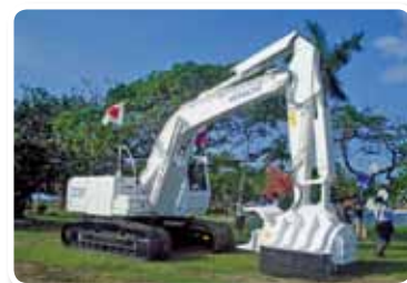
« Projet d'aide grâce à la fourniture d'équipements de déminage de mines antipersonnel, départements de Meta et Tolima », République de Colombie, année fiscale 2009