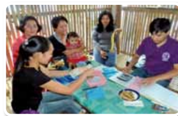
« Projet d'aide pour un fonds de microcrédits dans la province de Cotabato du Sud, île de Mindanao », République des Philippines, année fiscale 2010