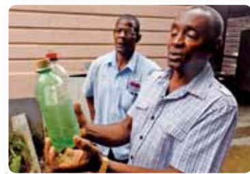
« Projet de formation des agriculteurs producteurs de café à la sécurité alimentaire et à la préservation de l'environnement », Jamaïque, année fiscale 2010